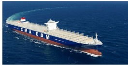
CMA CGM Marco Polo