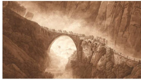
Le Pont du Diable dans les gorges de Schöllenen (Peter Birman). Source : Wikimedia Commons