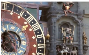
Hans Fries, conteur d'images Narration picturale et détails dans l'art fribourgeois autour de 1500 par Caroline Schuster Cordone

« Les rues, les ruelles et les bâtiments caractéristiques de Berne racontent des histoires passionnantes, et parmi elles, dans la partie basse de la vieille ville, se dresse l'un des monuments les plus célèbres : la Zytglogge (Tour de l'Horloge). Autrefois porte de la ville, la Tour de l'Horloge attire des spectateurs du monde entier. » extrait du site de l'office du tourisme.